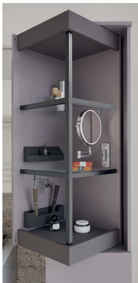
Avec option coiffeuse