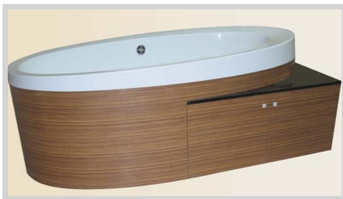
Tablier avec module de rangement Tub Surround with storage module