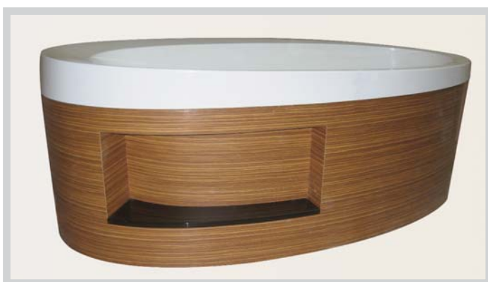
Tablier avec niche Tub Surround with niche